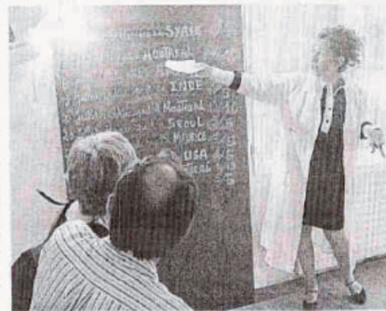
Dernière séance ce dimanche de « L'étonnante agence de voyage de la famille Debleu ».