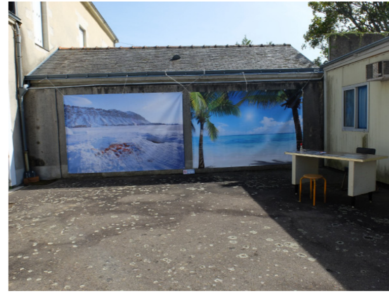
Installation à la mairie de Rouans (septembre 2013)