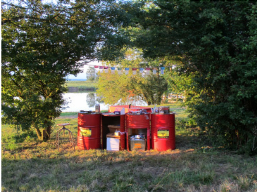
Installation à Frossay (juin 2010)